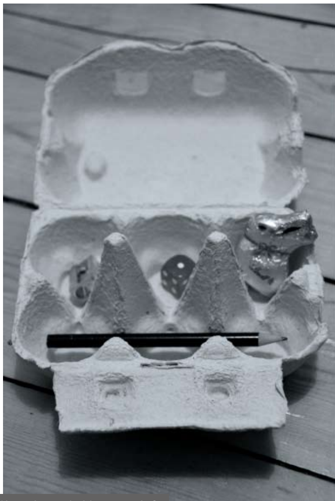
Wonach wurde hier gesucht?

Nach einer bestimmten Zeit trifft sich die Klasse wieder und stellt sich gegenseitig ihre gesammelten Gegenstände vor. Dabei kann man sich folgende Fragen stellen: