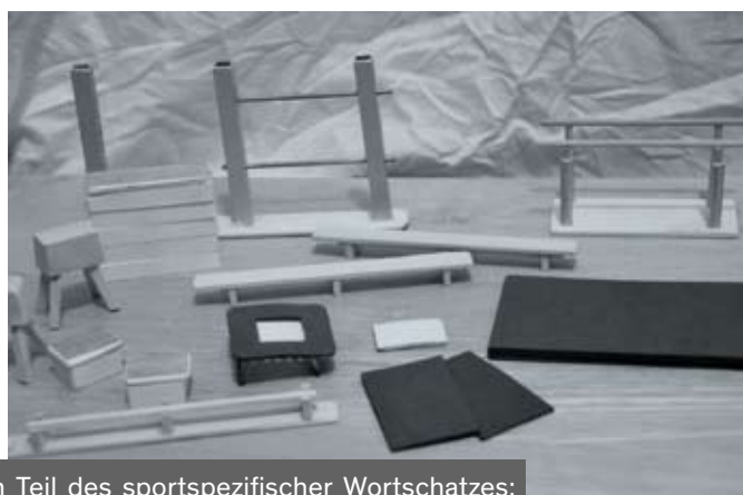
Ein Teil des sportsspezifischer Wortschatzes: die Bezeichnung der einzelnen Geräte

Der Sprachgebrauch in der Sporthalle zeichnet sich durch einen spezifischen (Fach-)Wortschatz aus. Die Lexik weist sportsspezifische Wortzusammensetzungen (=Komposita) oder Verben auf, die nicht immer bekannt sind und deren Bedeutung geklärt werden sollte.