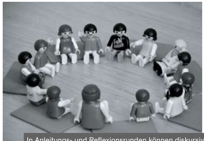
In Anleitungs- und Reflexionsrunden können diskursive Fähigkeiten gefördert werden.

Man ist auch ohne die Kompetenzen in der Lage, einen fachlichen Diskurs zu führen, etwas zu erklären oder zu beschreiben. Jedoch kommt es in solchen Fällen häufiger zu Verstehensschwierigkeiten oder die Lehrkraft muss gezielt nachfragen, um das Sprachverständnis zu sichern.