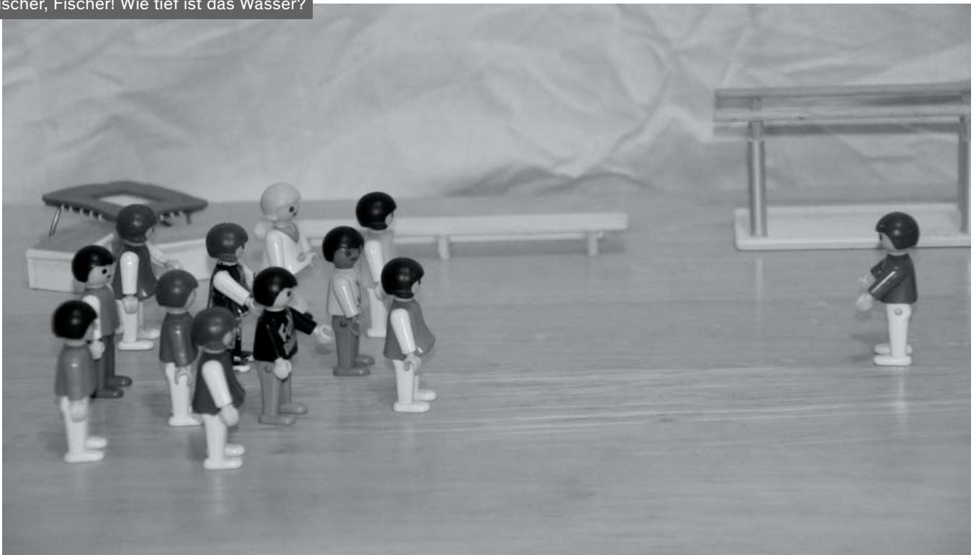
Fischer, Fischer! Wie tief ist das Wasser?

Wichtig ist, dass die Lehrkraft bei den Aufwärmübungen und Spielen laut und deutlich spricht und einen differenzierten Wortschatz benutzt. Im Anschluss an die Übungen und Spiele können die Bewegungsaufgaben noch einmal mündlich wiederholt werden.