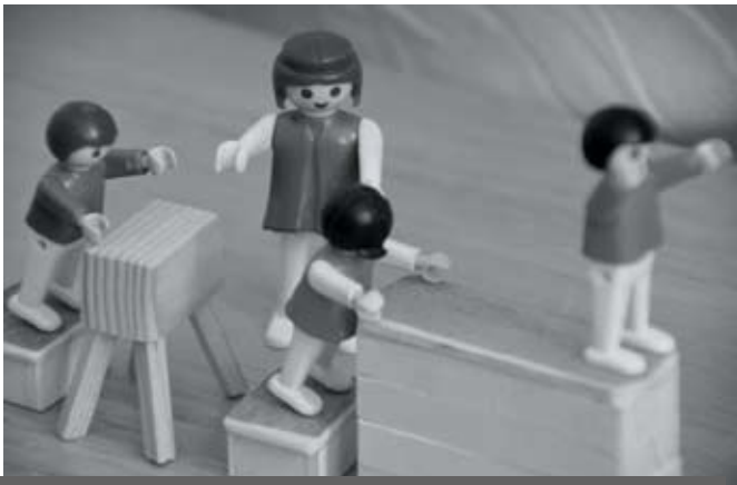
Die Lehrkraft stellt im Sportunterricht ein Sprachvorbild dar.

Im Sportunterricht findet immer eine sprachliche Verständigung statt. Der Sprachgebrauch in der Sporthalle ist dabei durch einen sportspezifischen Wortschatz und einen bestimmten Satzbau gekennzeichnet. Es werden z.B. vermehrt Modalverben (z.B. müssen, sollen ) sowie Imperative ( Mach das! Komm her! ) gebraucht. Dabei kommt der Sprachvorbildfunktion eine wichtige Rolle zu. Die SchülerInnen können einerseits füreinander ein Sprachvorbild bilden, andererseits stellt vor allem die Lehrkraft in jedem Sportunterricht ein wertvolles Sprachvorbild dar, an deren Sprachgebrauch sich die SchülerInnen orientieren.